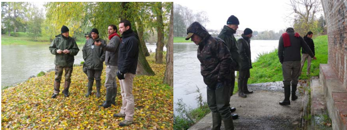
A la recherche des indices de présence sous le pont d'Auterive