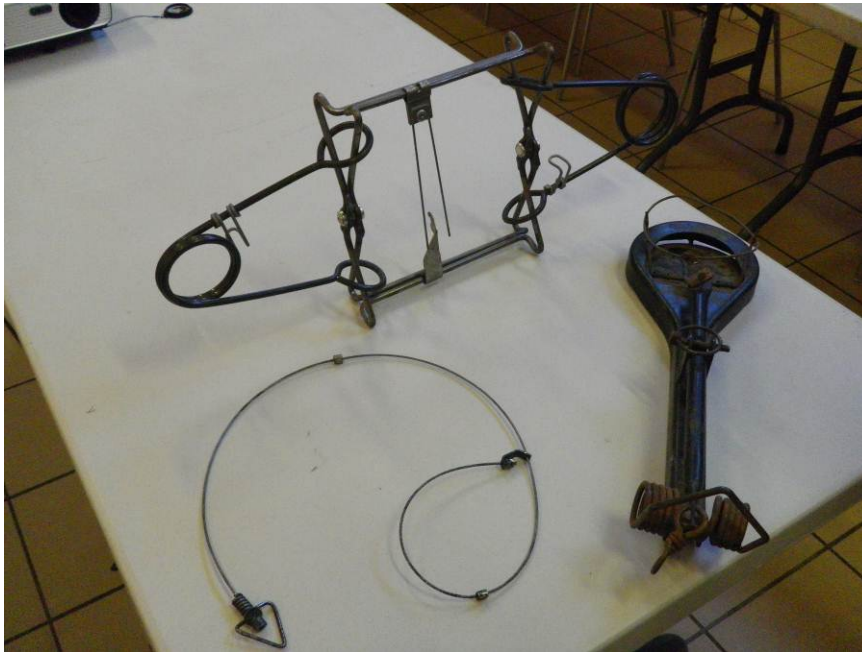
Illustration de différents types de pièges