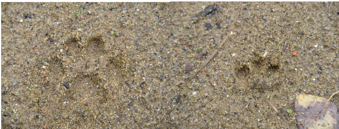
Traces de pas de loutre et de vison d'Amérique

La sortie sur le terrain s'est déroulée au niveau du pont le plus aval de Cintegabelle puis au pont d'Auterive afin de montrer aux participants les zones potentielles de marquage de la loutre et des mustélidés en particulier. La dynamique des populations de la loutre sur la zone ne permet pas, à l'heure actuelle, de trouver des indices de présence (traces de pas, épreintes...). Vincent LACAZE avait amené pour l'occasion des tampons représentant les traces de pas de la loutre, du vison, du chat... ainsi que des épreintes récoltées par ailleurs. Toutefois, la sortie a permis de visualiser des laissées de petit mustélidé, probablement du vison d'Amérique.