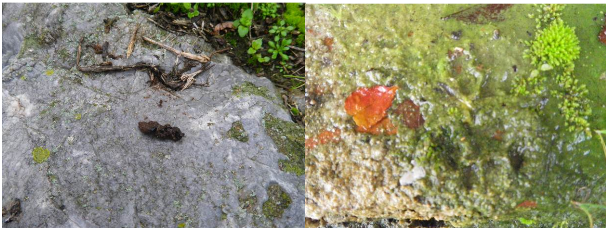
Laissée et traces probables de vison d'Amérique observées sous le pont d'Auterive