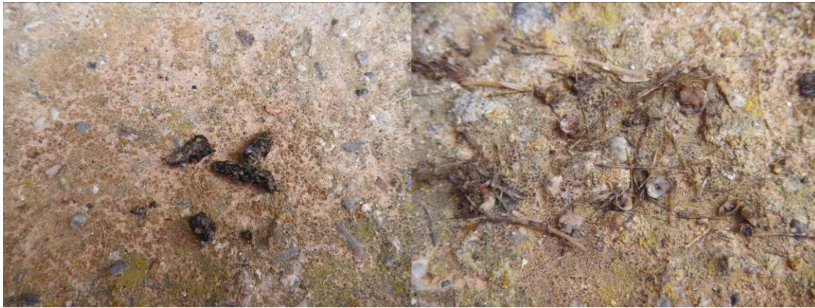
Eprintes de loutre et leur contenu détaillé