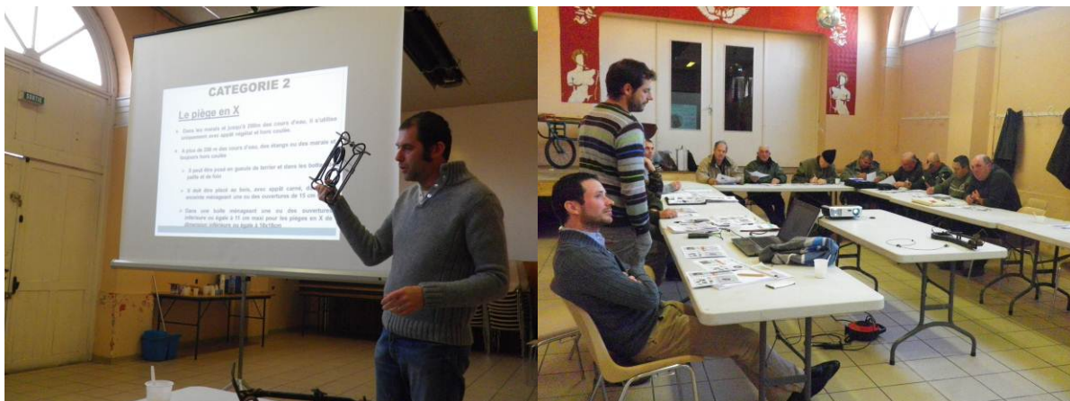
Les 2 présentations en salle (matin et après-midi)

L'intervention de l'après-midi a permis d'aborder la présentation de deux espèces : la loutre d'Europe et le vison d'Amérique. Pour chacune de ces espèces, sa description, des éléments de reconnaissance par rapport à d'autres mustélidés, ses caractéristiques écologiques, sa dynamique des populations en Midi-Pyrénées et plus localement sur les sites Natura 2000 ont été présentés. Plus spécifiquement pour le vison, espèce classée nuisible, les menaces pour d'autres espèces animales ont été abordés ainsi que les méthodes de lutte déjà utilisées ailleurs.