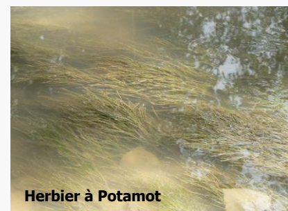
Herbier à Potamot