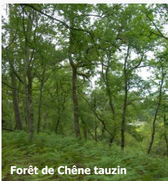
Forêt de Chêne tauzin

Les forêts alluviales résiduelles, dominées par l'aulne, sont situées sur des stations humides périodiquement inondées, le long des petits ruisseaux sur la partie landaise. Les vieilles chênaies acidiphiles présentent des peuplements âgés, plutôt ouverts avec une strate herbacée dominée par la molinie. Les forêts à chênes Tausins, caractérisées par cette espèce, sont situées en sommet de pente et sur le plateau.